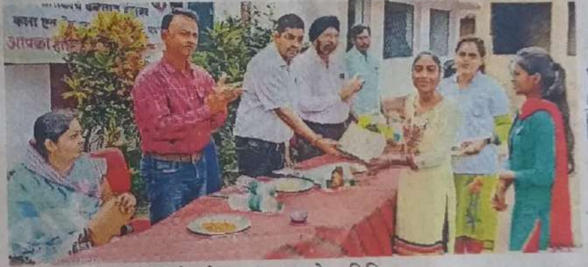
प्रतियोगिता के विजेताओं को पुरस्कृत करते अतिथि।